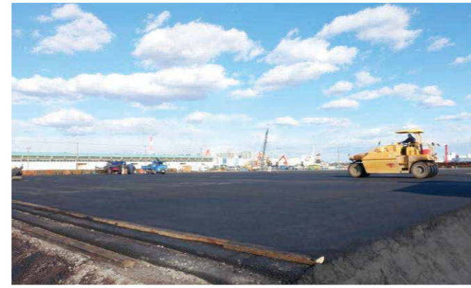
県単港湾整備(港建特別)工事 (中央埠頭野積場舗装工その3)