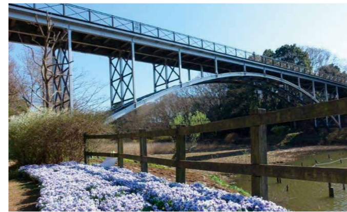
アンデルセン公園太陽の橋補修工事