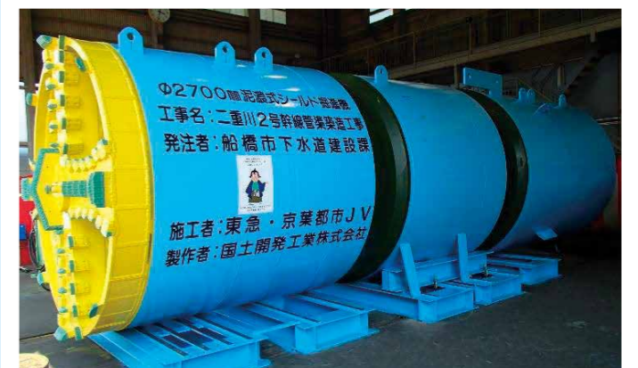
二重川2号幹線管渠築造工事 (JV)