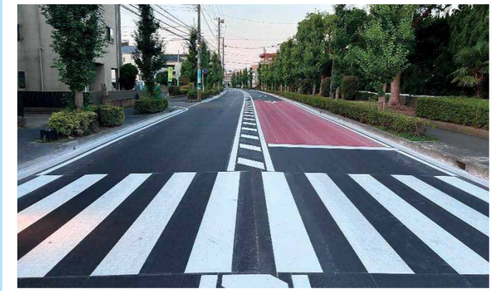
市道00-033号線舗装修繕工事