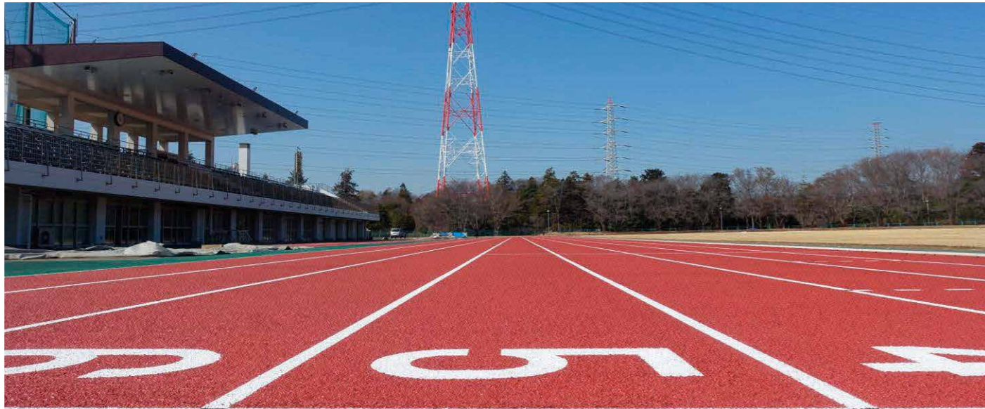
船橋市運動公園陸上競技場2種公認継続に伴う改修工事