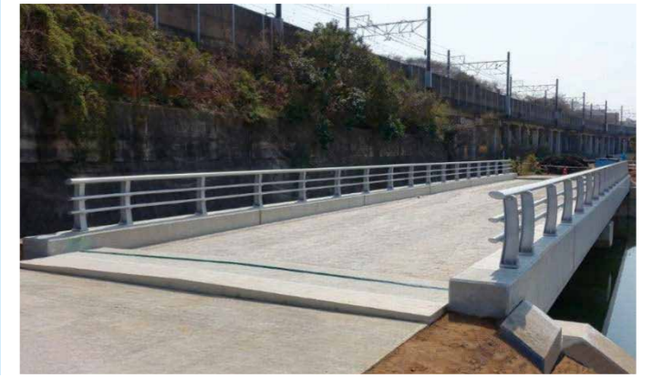
住宅基盤整備工事(飯山満川2号調整池上部)