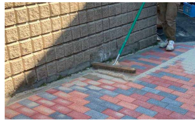
歩道部インターロッキング道路復旧工事