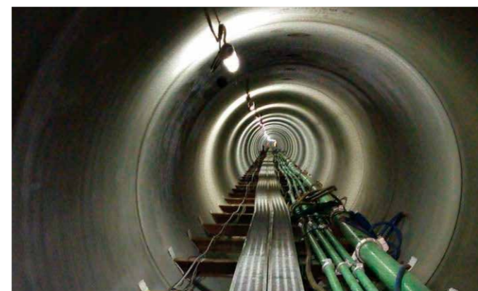
二重川2号幹線管渠築造工事 (JV)