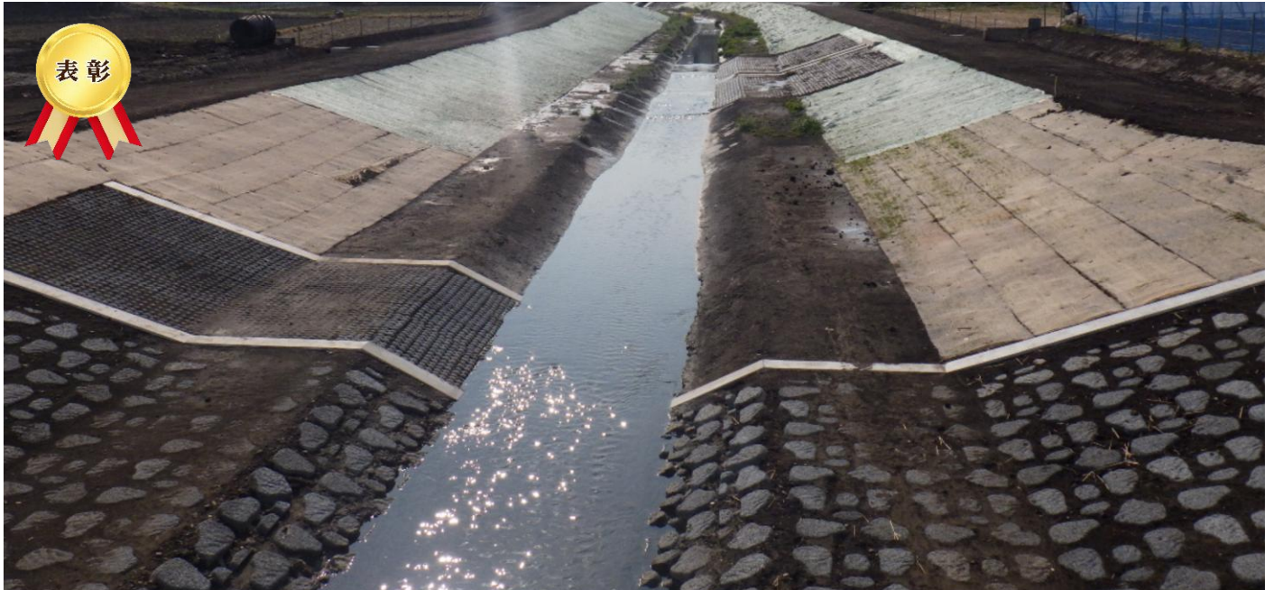
木戸川改修工事（その16）