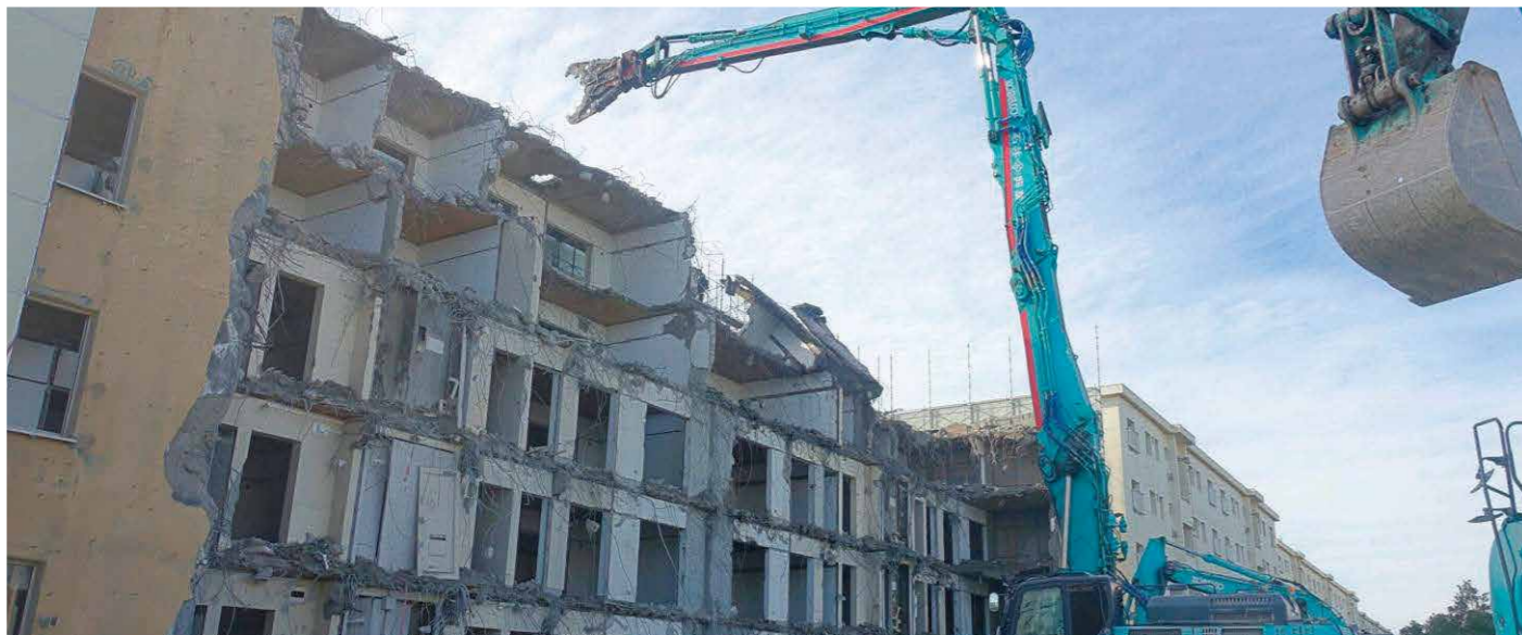
国家公務員宿舎船橋行田住宅跡地建築物等解体工事