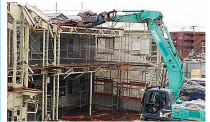
物流センター・事務所解体工事