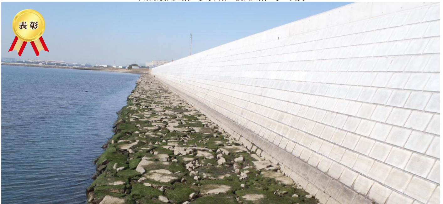
港湾災害復旧工事（23災第10号その2）