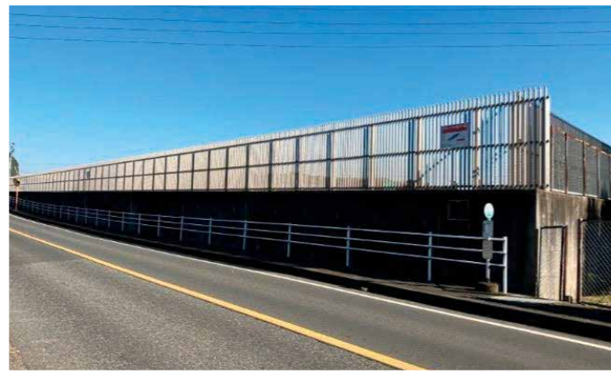
フェンス設置工事