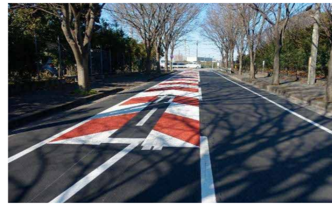
市道00-021号線舗装修繕工事