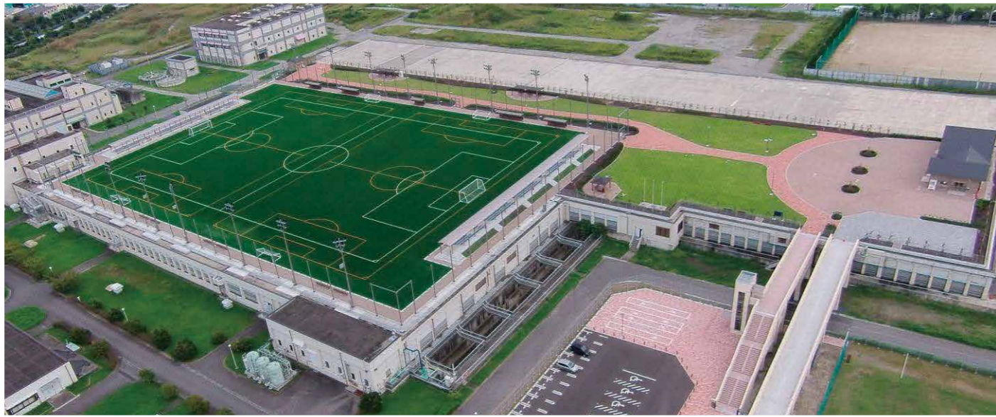
高瀬下水処理場上部運動広場整備工事 (JV)