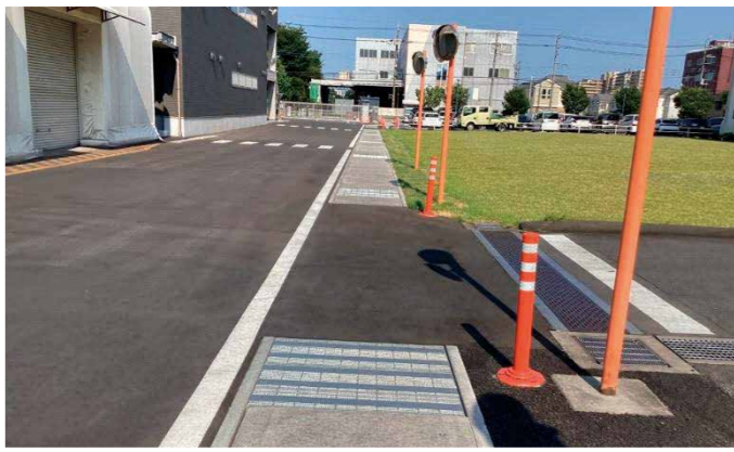
工場敷地内雨水排水更新工事