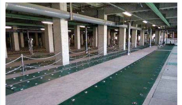
高瀬下水処理場水処理施設覆蓋更新工事