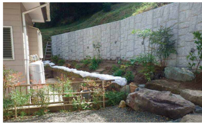
法面崩壊対策工事