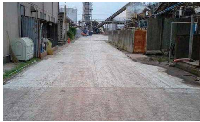
工場敷地内道路コンクリート舗装改修工事