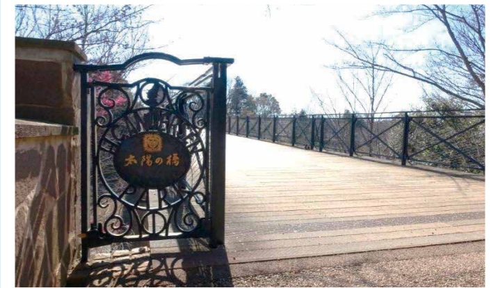
アンデルセン公園太陽の橋補修工事